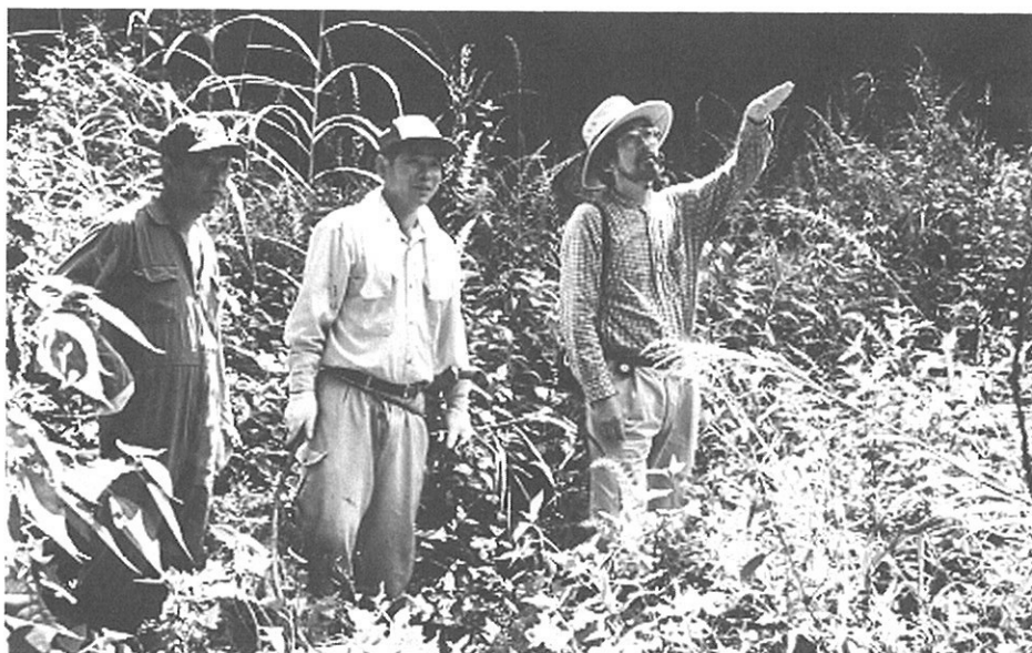
むら人は大学の砂防専門家と最初から交流してきた

アカタン砂防堰堤が、すべて藪の中から発見された平成16年、「砂防フィールド・ミュージアムを考えるシンポジウム」を開催した。新潟、岐阜、富山、福井、京都の砂防交流シンポジウムである。パネラーに、新潟県新井市西野谷の万内川砂防公園で活動する「砂防文化財を活かす地区懇談会」、