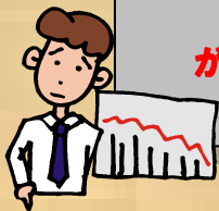
県内の公共交通機関輸送人員